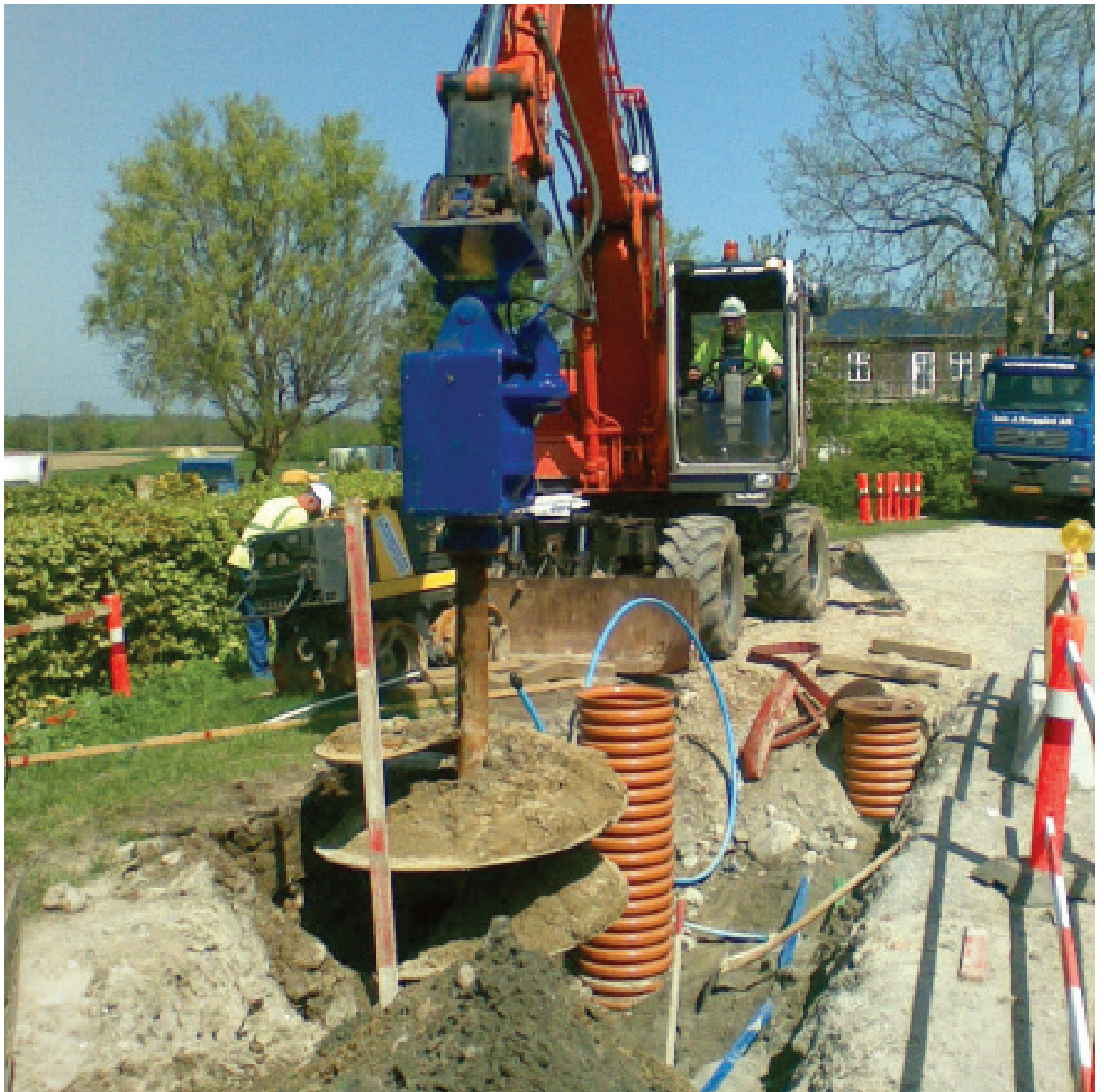
Vi forsøger at skabe mindst mulige gener for trafikken og de berørte ejendomme.