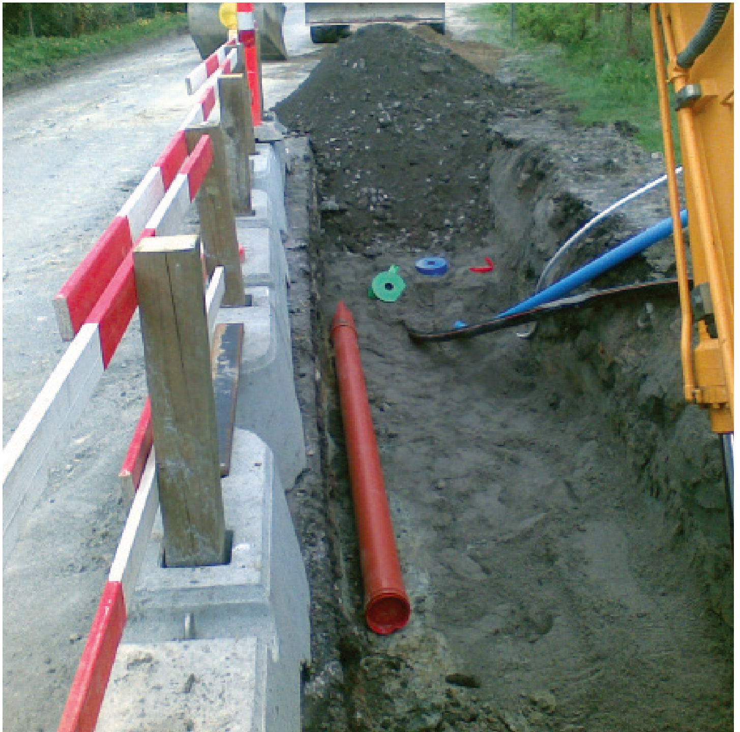
Når vi anvender tryksatte systemer, kan vi bruge mindre rør, som er nemmere at lægge i jorden.